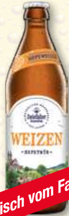
Frisch vom Fass